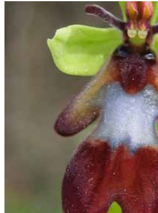
Détail d'une orchidée sauvage : l'ophrys mouche

Parmi les actions au long cours, la branche « Solimence » de l'association continue un travail de conservation dynamique des variétés potagères locales en partenariat avec le Musée du Revermont. La prospection de vestiges archéologiques sur l'ensemble du Revermont se poursuit. Le fonds d'ouvrages consacrés au Revermont s'enrichit et est accessible à tous à la bibliothèque municipale de Treffort-Cuisiat.