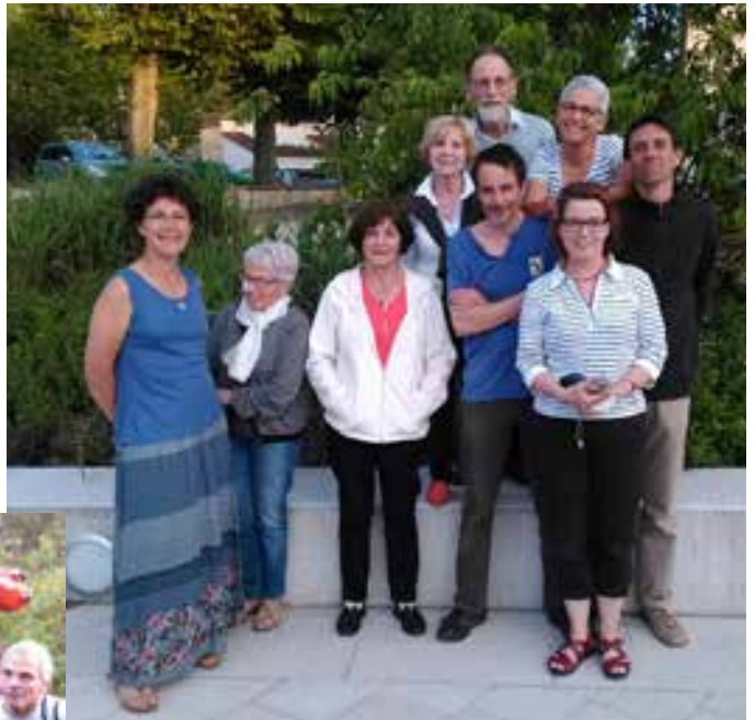
Le conseil d'administration de l'association