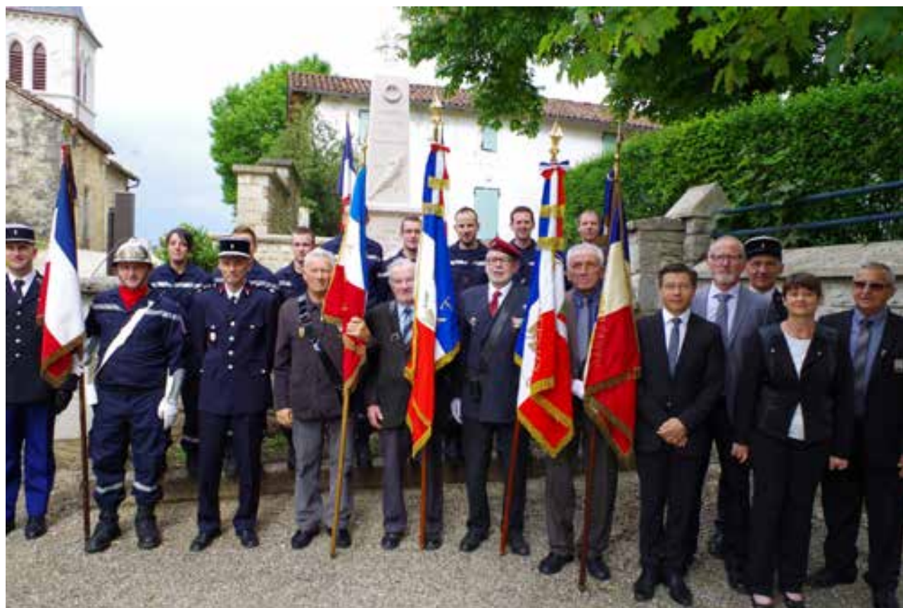
Commémoration du 8 Mai 1945 à Pressiat