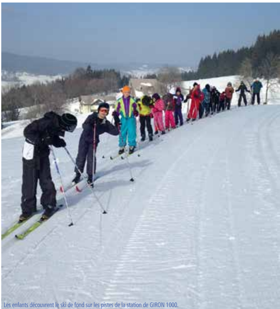
Les enfants découvrent le ski de fond sur les pistes de la station de GIRON 1000.