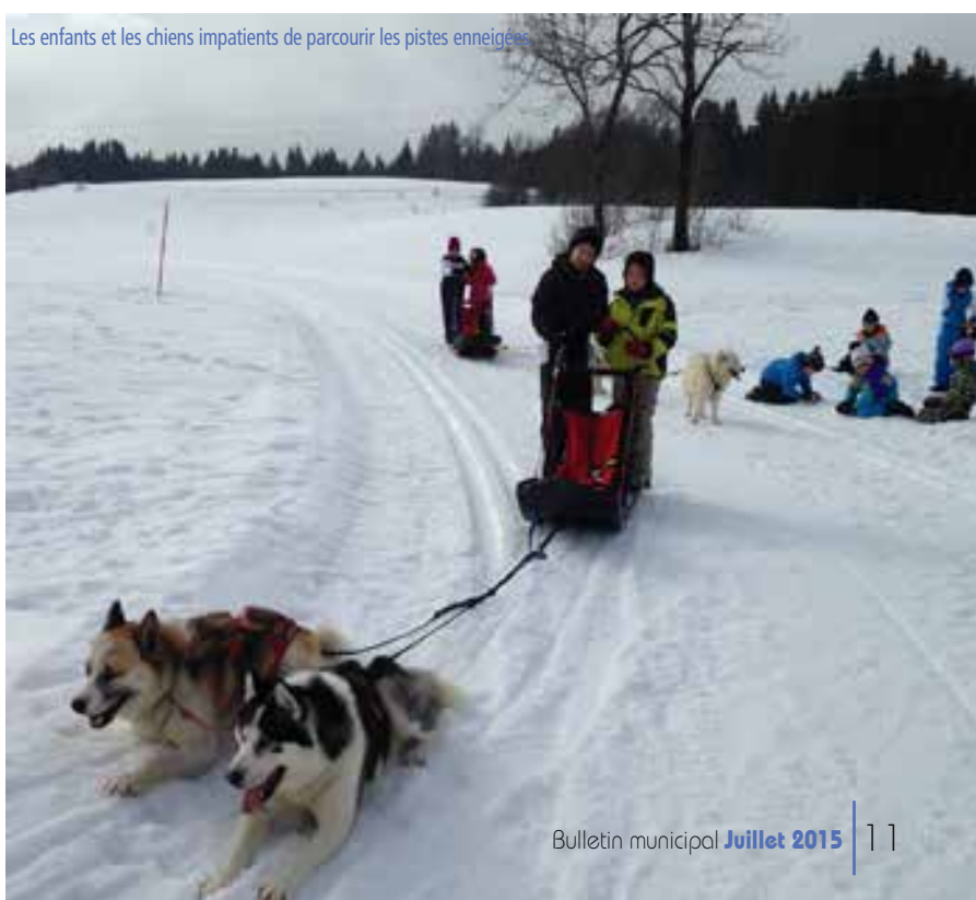
Les enfants et les chiens impatients de parcourir les pistes enneigées.