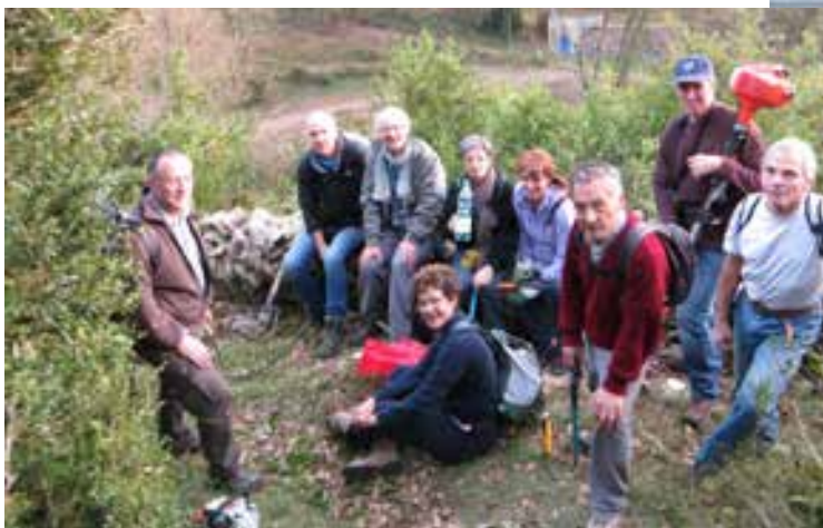
L'entretien du sentier des crêtes de Palanche