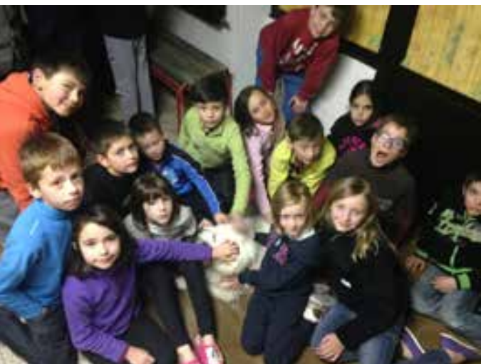
La petite troupe, fatiguée, mais contente.